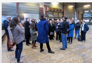
Visite des ateliers décors du TNP le 27 février