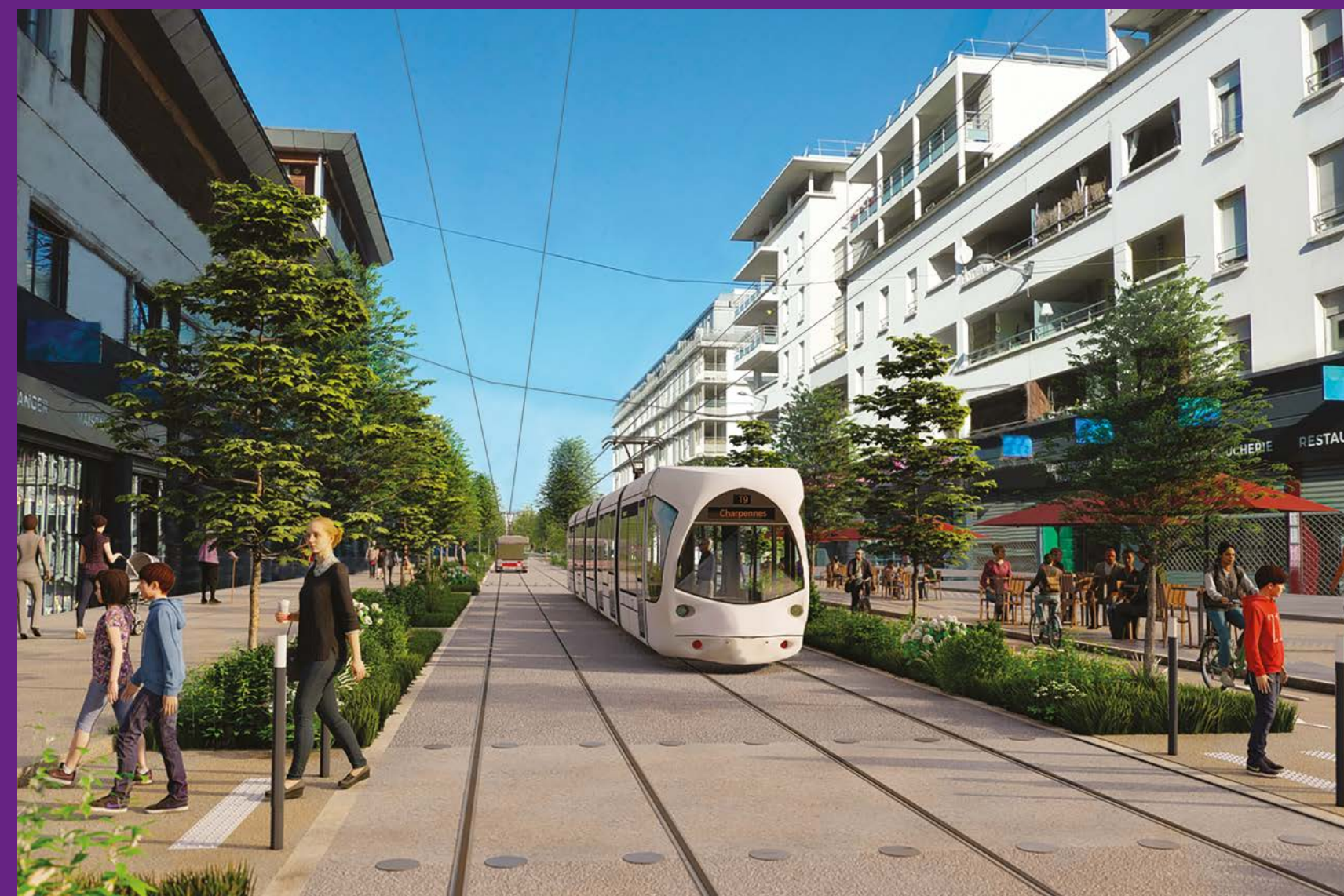
Vaux-en-Velin centre, rue Émile Zola, section apaisée sans circulation automobile.