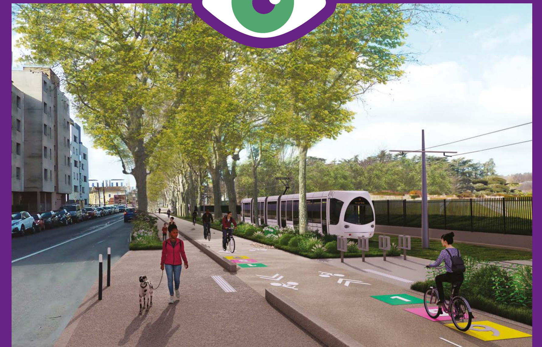
Villeurbanne, avenue Albert Einstein, au droit de la Nécropole Nationale de La Doua.