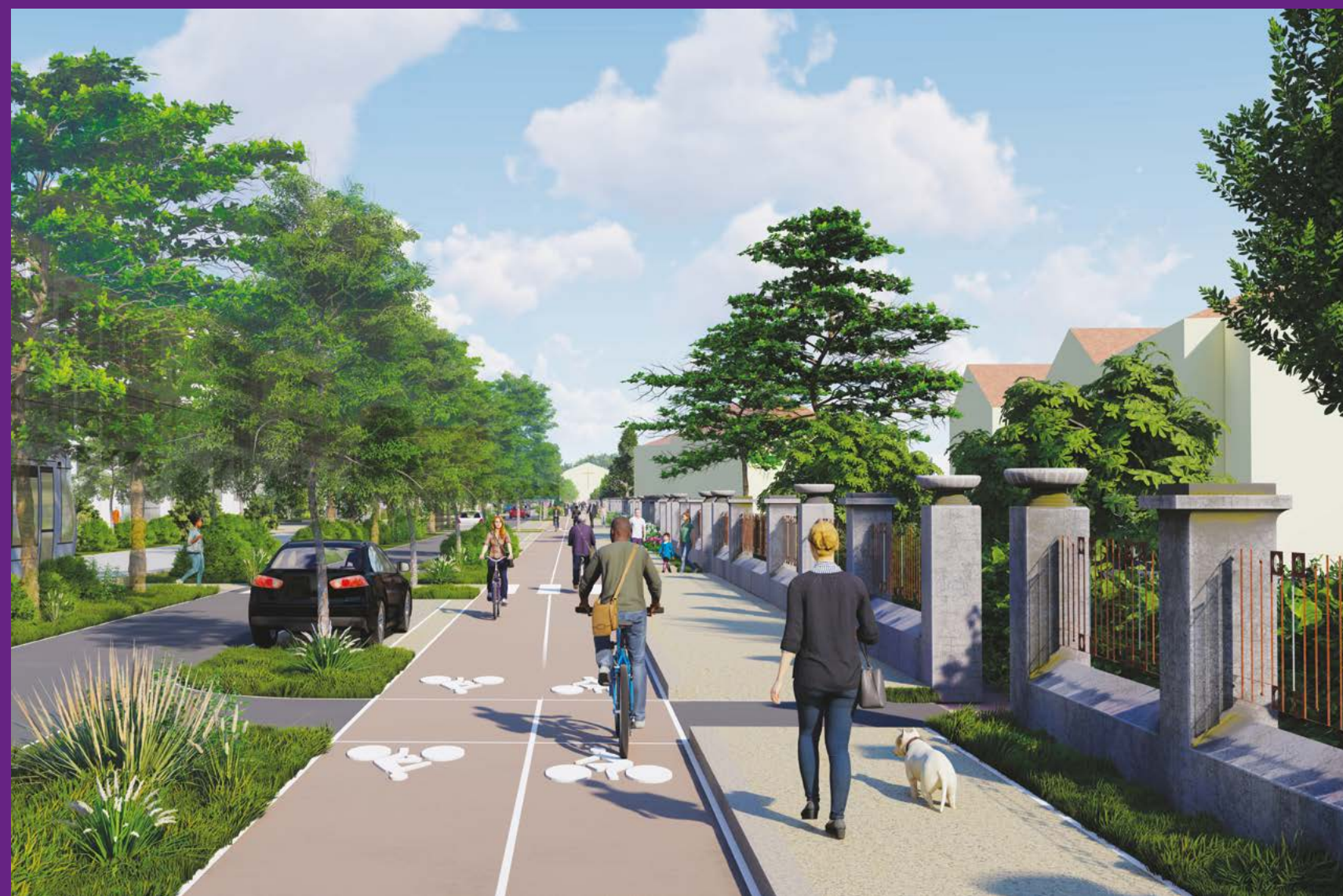
Vaux-en-Velin, avenue Bataillon Carmagnole Liberté, devant l'usine TASE.