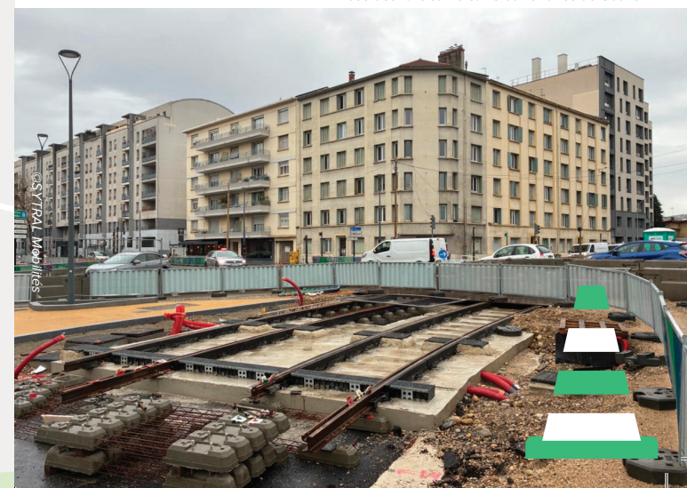
Pose des rails sur le carrefour Charles de Gaulle

La pose des rails continue au sud du carrefour Charles de Gaulle. Sur la rue de la Feyssine, la future station est en construction.